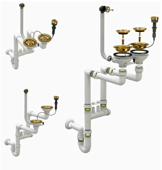
Syfon z korkiem automatycznym