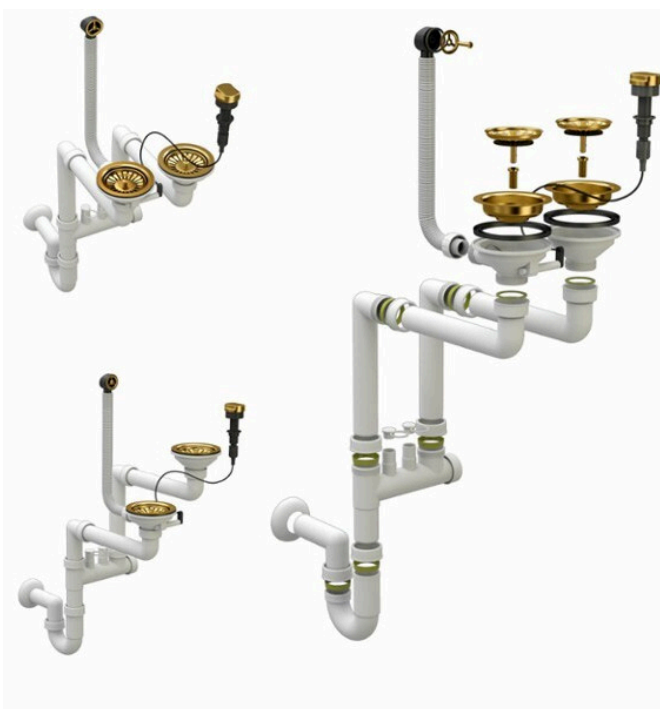
Syfon z korkiem automatycznym